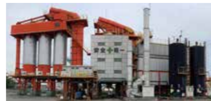
アスファルト合材プラント

近年、高度に改質された各種ポリマー改質アスファルトや特徴のある工法が開発されており、これらの活用が進んでいます。千葉県では、維持修繕の効率化、LCCの低減、道路利用者負担の軽減、CO2排出抑制などを実現するためにはアスファルト舗装の長寿命化が不可欠であると考え、試験舗装を活用しこれらの効果的な活用方法について検討しています。以下に取り組みの概要を紹介します。