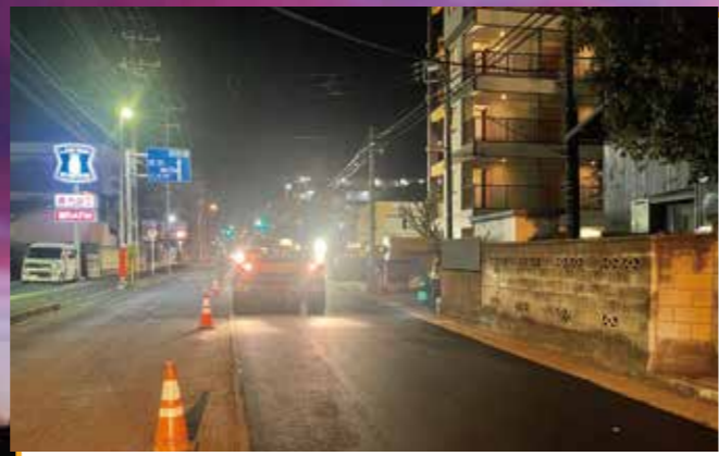
27:30 タイヤローラーでの2次転圧