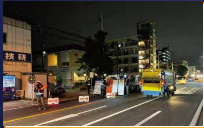
22:00 交通規制スタート

主要幹線道路や交通量の多い市街地では、通行への影響を最小限に抑えるため、22時から朝5時に夜間工事を実施しています。限られた時間の中で、最大限品質を確保しながら県民の安全を守る作業に取り組んでいます。《例：一般国道296号、切削OL工事》