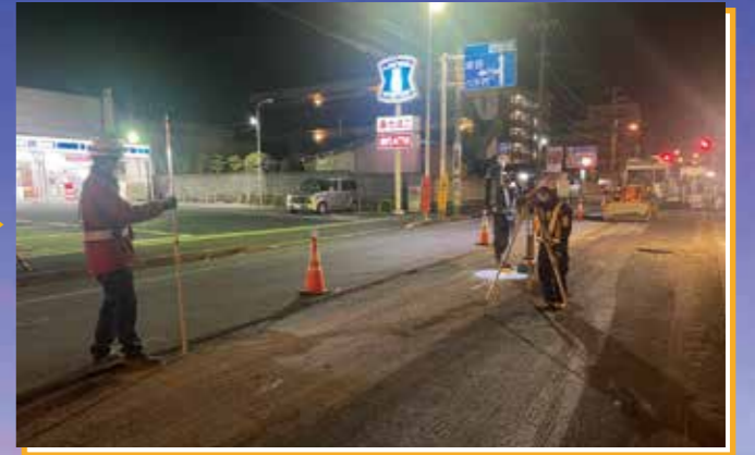
24:30 測量 出来形確認