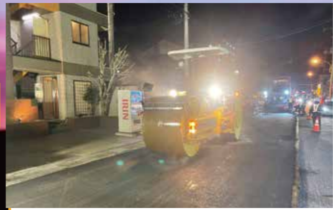
26:30 マカダムローラーでの1次転圧