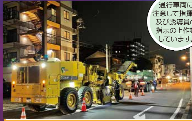
22:30 切削機による路面切削開始